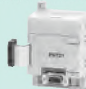
CPM1A-PRT21 Входные данные: 16 бит Выходные данные: 16 бит