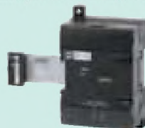
CP1W-SRT21 Входные данные: 8 бит Выходные данные: 8 бит