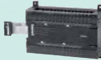
CP1W-20EDT Входы постоянного тока: 12 Транзисторные выходы (NPN): 8