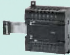
CP1W-16ER Релейные выходы: 16