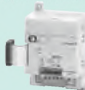
CPM1A-DRT21 Входные данные: 32 бит Выходные данные: 32 бит