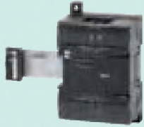
CP1W-8ED Входы постоянного тока: 8