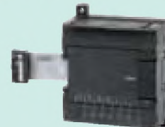
CP1W-TS001 Входы термодпар: 2